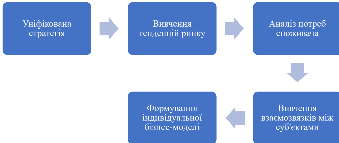
Рис. 4. Процес формування бізнес-моделі на основі уніфікованої стратегії.

отримати більш детальне уявлення про те, які види діяльності потрібно об'єднати для розвитку прибуткової і перспективної співпраці [11].