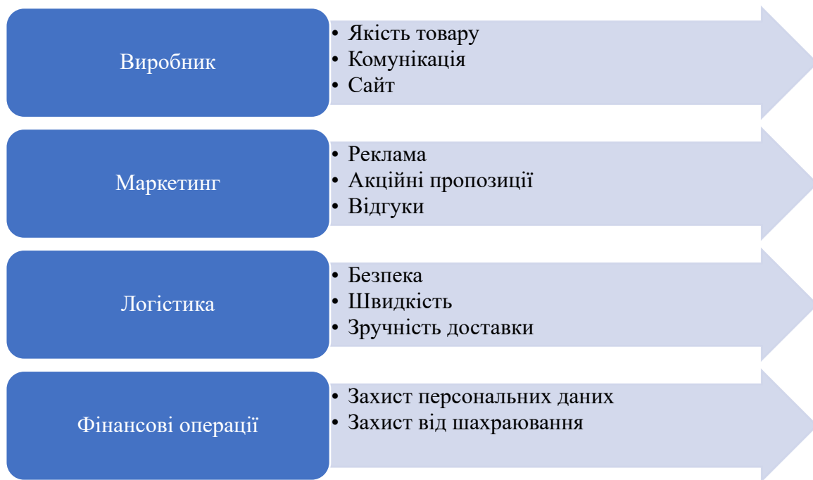
Рис. 3. Складові електронної комерції у відносинах бізнес-споживач