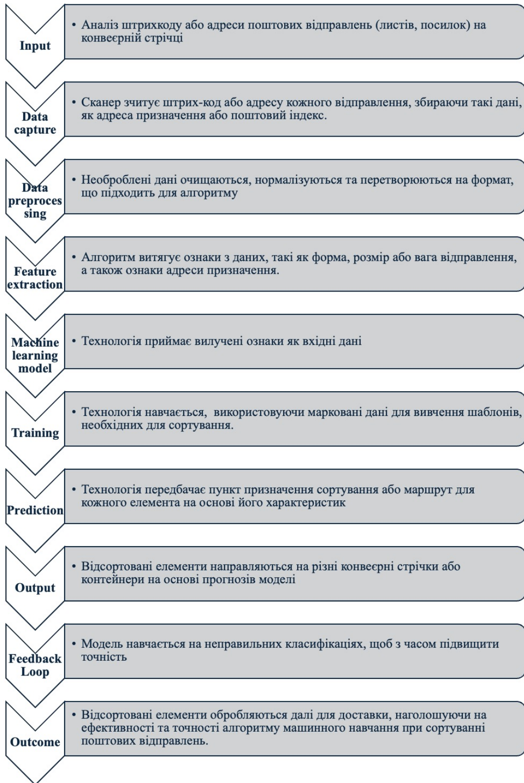
Рис. 1. Схема алгоритму машинного навчання, що обробляє поштові відправлення для сортування