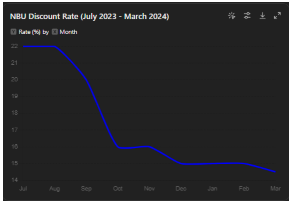
Рис. 1. Динаміка облікової ставки НБУ