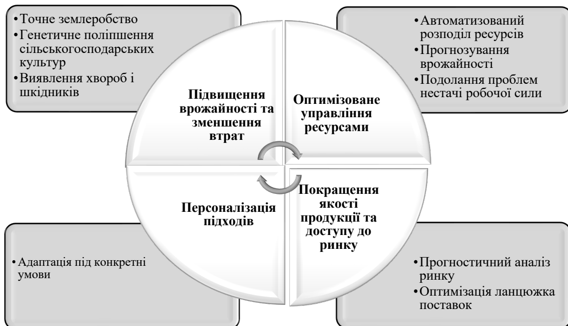
Рис. 1. Напрямки застосування ІІІ для підвищення економічної ефективності сільськогосподарських підприємств

Розглянемо деякі області застосування ІІІ в сільському господарстві (рис. 1). Однією з найперспективніших сфер застосування ІІІ є точне землеробство. Починаючи з висіву насіння і закінчуючи збором врожаю, все частіше використовуються роботи, керовані штучним інтелектом, які можуть виконувати такі завдання як: прополювання, збирання врожаю і пакування продуктів харчування, звільняючи людей для складнішої роботи. Роботи можуть виконувати різні завдання, які традиційно виконують люди, але з більшою швидкістю і точністю.