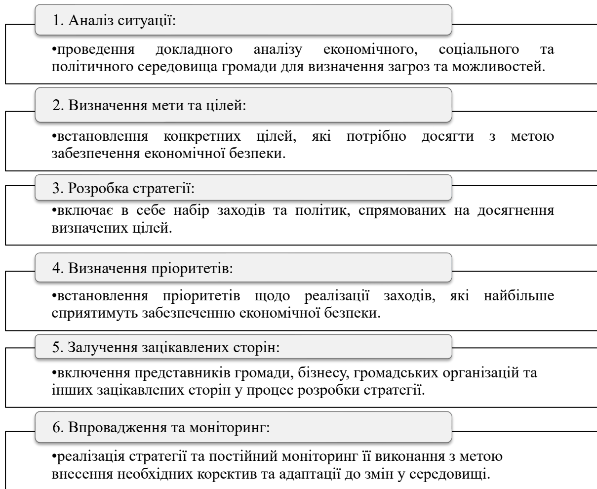
Рис. 2. Етапи формування стратегії забезпечення економічної безпеки територіальних громад