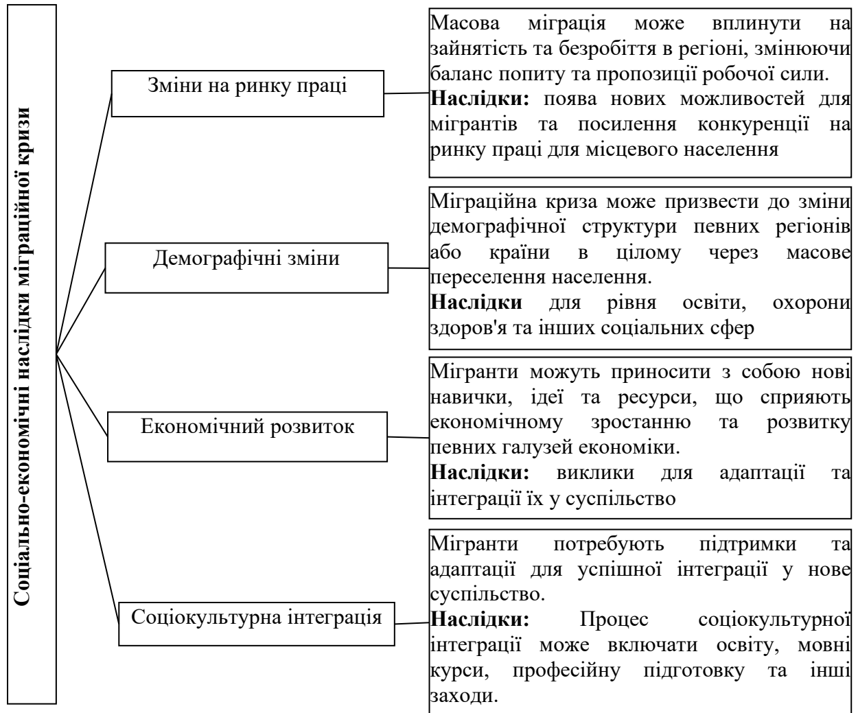
Рис. 2. Соціально-економічні наслідки міграційної кризи в Україні

у зайнятості, віковій структурі населення, економічному зростанні та сприйнятті мігрантів у суспільстві (рис. 2):