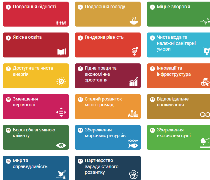
Рис. 1. 17 Цілей сталого розвитку [8]

З метою контролю досягнення цілей сталого розвитку, прийняття управлінських рішень та оцінювання ефективності реалізованих заходів, світовою спільнотою розроблено низку індикаторів сталого розвитку.