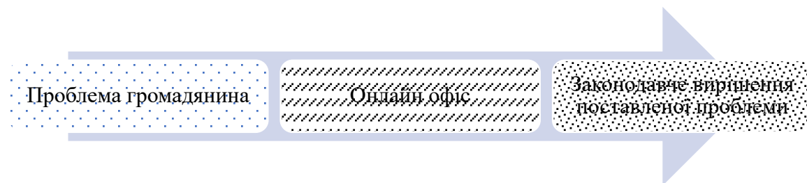
Рис. 1. Схема взаємодії громадян з органами публічного управління через модель «Електронного уряду»

Government) є надзвичайно ефективною формою застосування функцій публічного управління в умовах воєнних дій на території області й України в цілому, так як дозволяє підтримувати зв'язки з громадянами та надавати їх адміністративні послуги в найбільш безпечному режимі, без фізичної присутності при вирішенні виниклих проблем. Важливим кроком України у напрямку здійснення нормативного забезпечення переходу до цифрової системи публічного управління став проект розпорядження Кабінету Міністрів України «Про схвалення Концепції розвитку цифрової економіки та суспільства України на 2018- 2020 рр.» та затвердження плану заходів щодо її реалізації, відповідно до якого передбачено цілий комплекс заходів щодо цифровізації системи державного управління, а також економіки, суспільної та соціальної сфер, стимулювання використання та споживання цифрових технологій. Специфікою взаємодії громадян з органами публічного управління, через застосування моделі «Електронного уряду», представленою нами на рис. 1., є швидкість обробки заяв та вирішення проблем громадян без витрат ними реального часу.