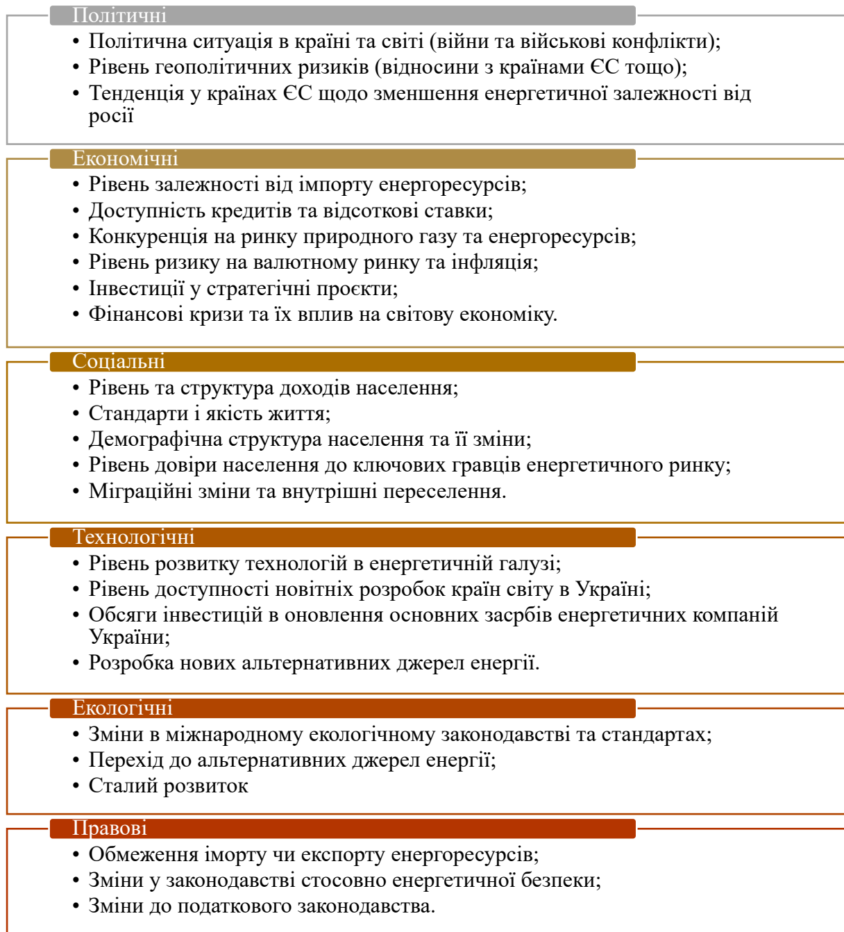
Рис. 1. PEST-аналіз чинників, що впливають на фінансовий розвиток НАК «НАФТОГАЗ УКРАЇНИ»