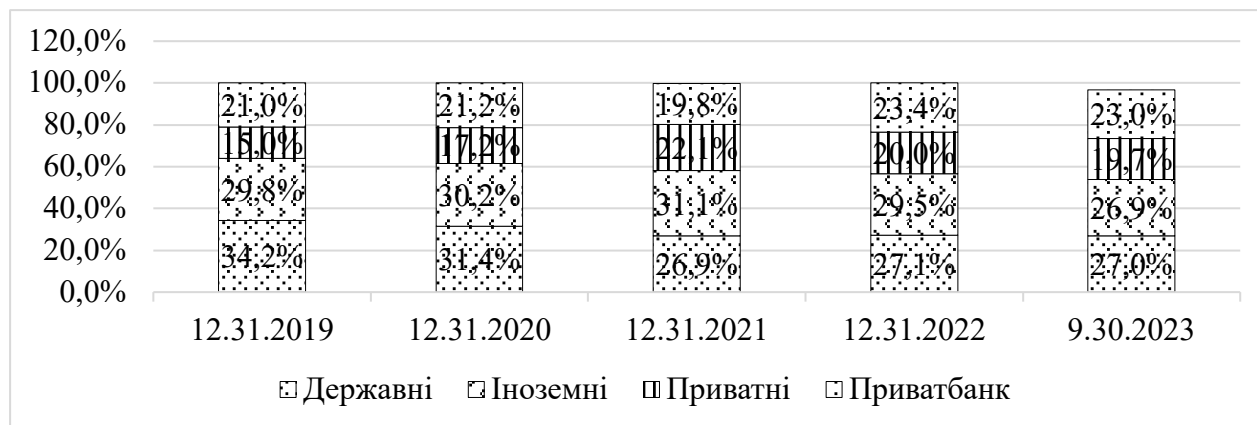
Рис. 2. Чисті активи у розрізі груп банків