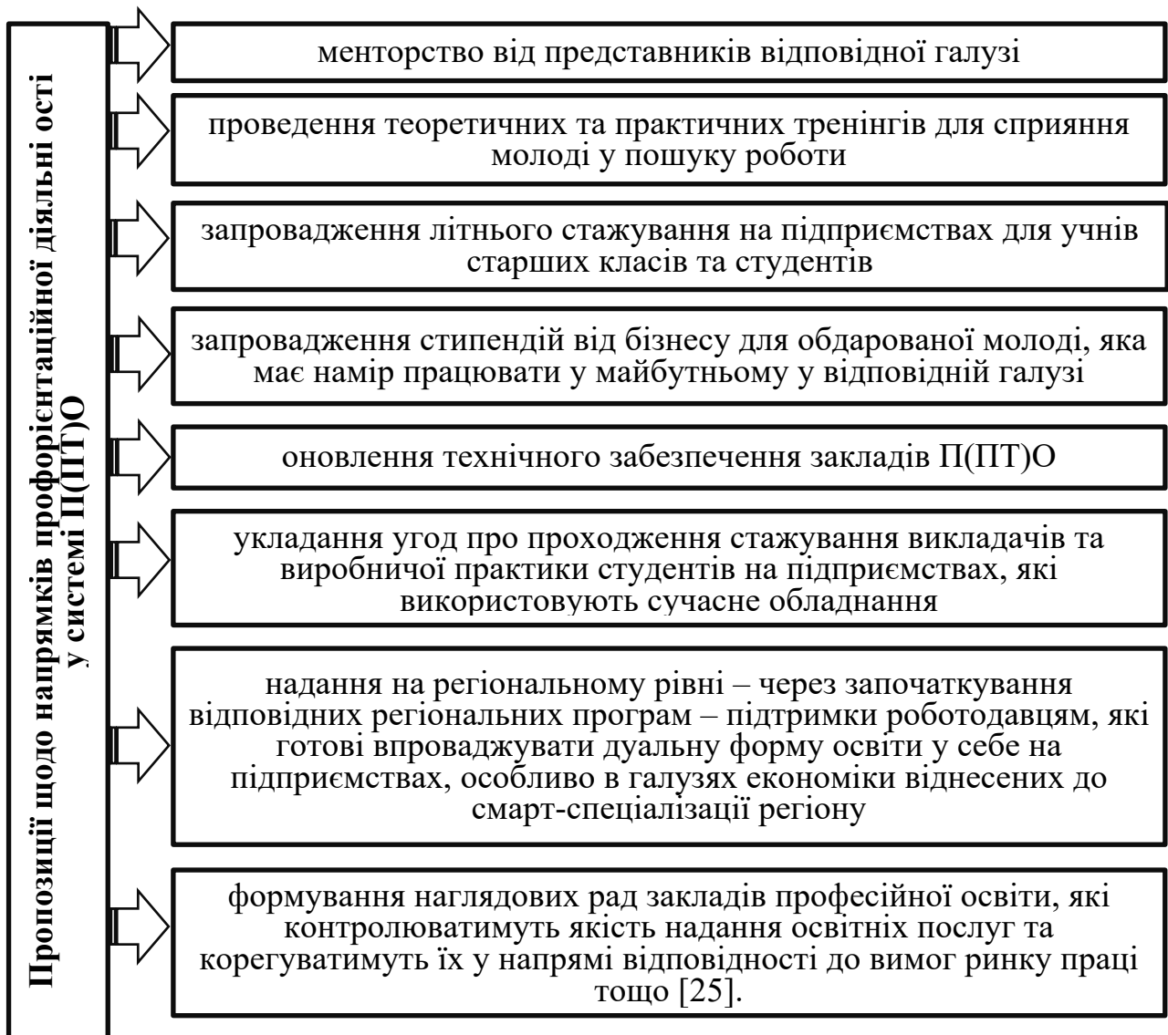
Рис. 3. Пропозиції щодо напрямків профорієнтаційної діяльності у системі П(ПТ)О [24]

Переконана, реформування освіти як одного з напрямків молодіжної політики має бути комплексним, охоплювати усі ступені: підготовку викладачів, цифровізацію процесу навчання, дуалізацію освіти, формування професійної культури та забезпечення випускника першим робочим місцем.