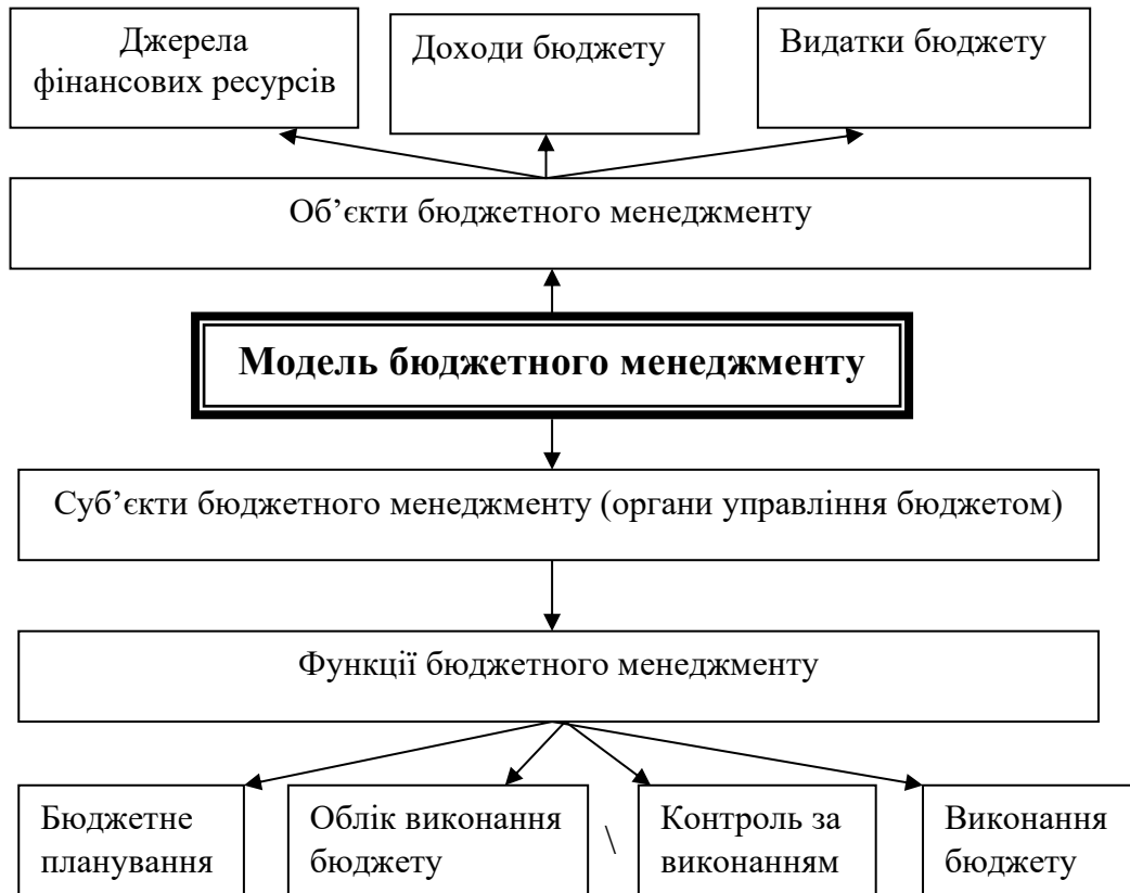
Рис. 1. Модель бюджетного менеджменту