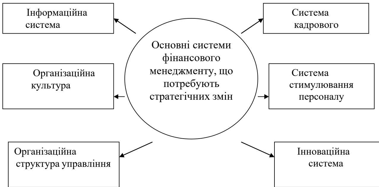
Рис. 3. Основні складові системи фінансового менеджменту, що потребують стратегічних змін в контексті реалізації фінансової стратегії

менеджменту. Цей вибір визначається конкретними умовами зовнішнього фінансового середовища, що можуть бути стабільними або змінюватися швидко. Це впливає на динаміку використання конкретних методів управління фінансовою стратегією на різних етапах, включаючи формування та реалізацію конкретної стратегії в межах встановленої фінансової політики.