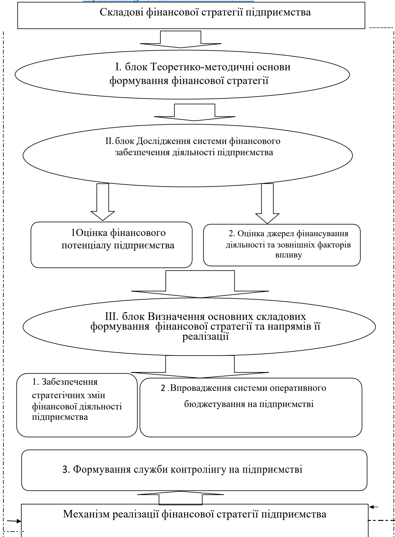
Рис. 1. Модель формування фінансової стратегії підприємства