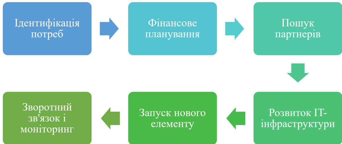
Рис. 2. Дорожня карта масштабування інноваційної інфраструктури закладу вищої освіти

сталого розвитку та підтримки конкурентних позицій на ринку освітніх та наукових послуг.