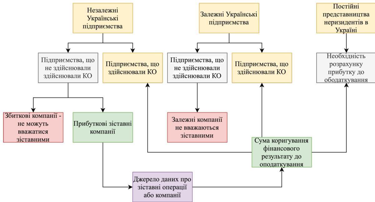
Рис. 1. Схема взаємозалежності фінансових результатів підприємств через механізм трансфертного ціноутворення