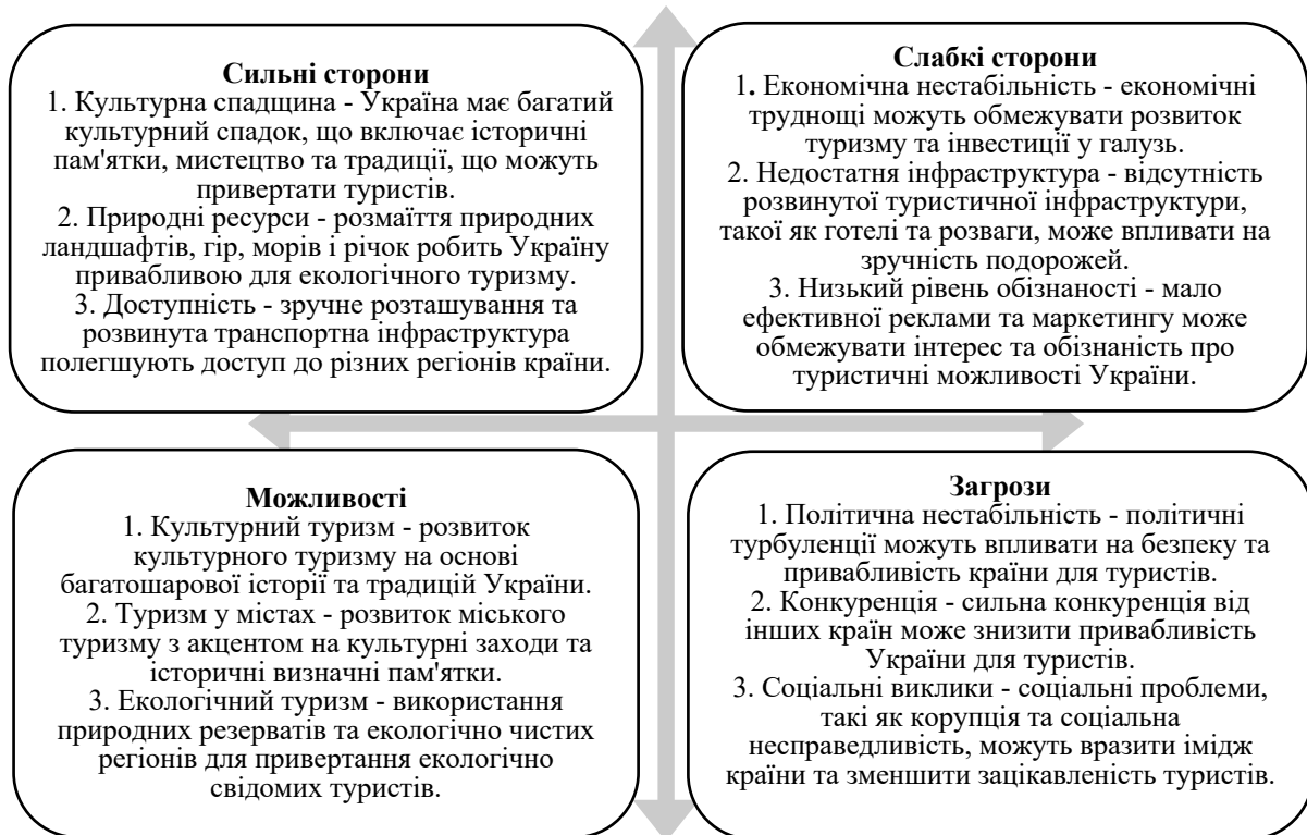
Рис. 2. SWOT-аналіз розвитку сфери туризму в післявоєнний період

максимізуючи можливості, а також працюючи над подоланням слабкостей та запобіганням загроз (рис. 2):