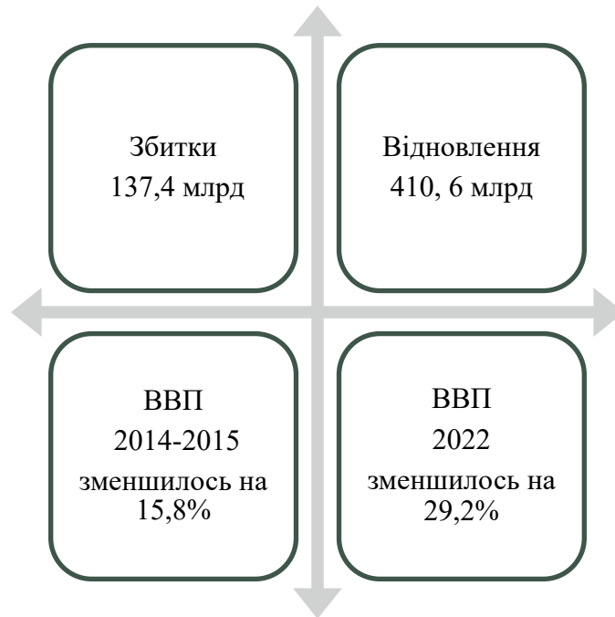
Рис. 2. Збитки, завдані Україні в період з 24 лютого 2022 р. до 24 лютого 2023 р.