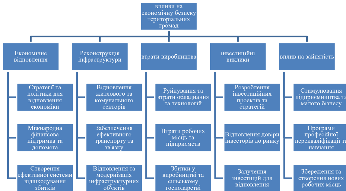
Рис. 2. Впливи на економічну безпеку територіальних громад