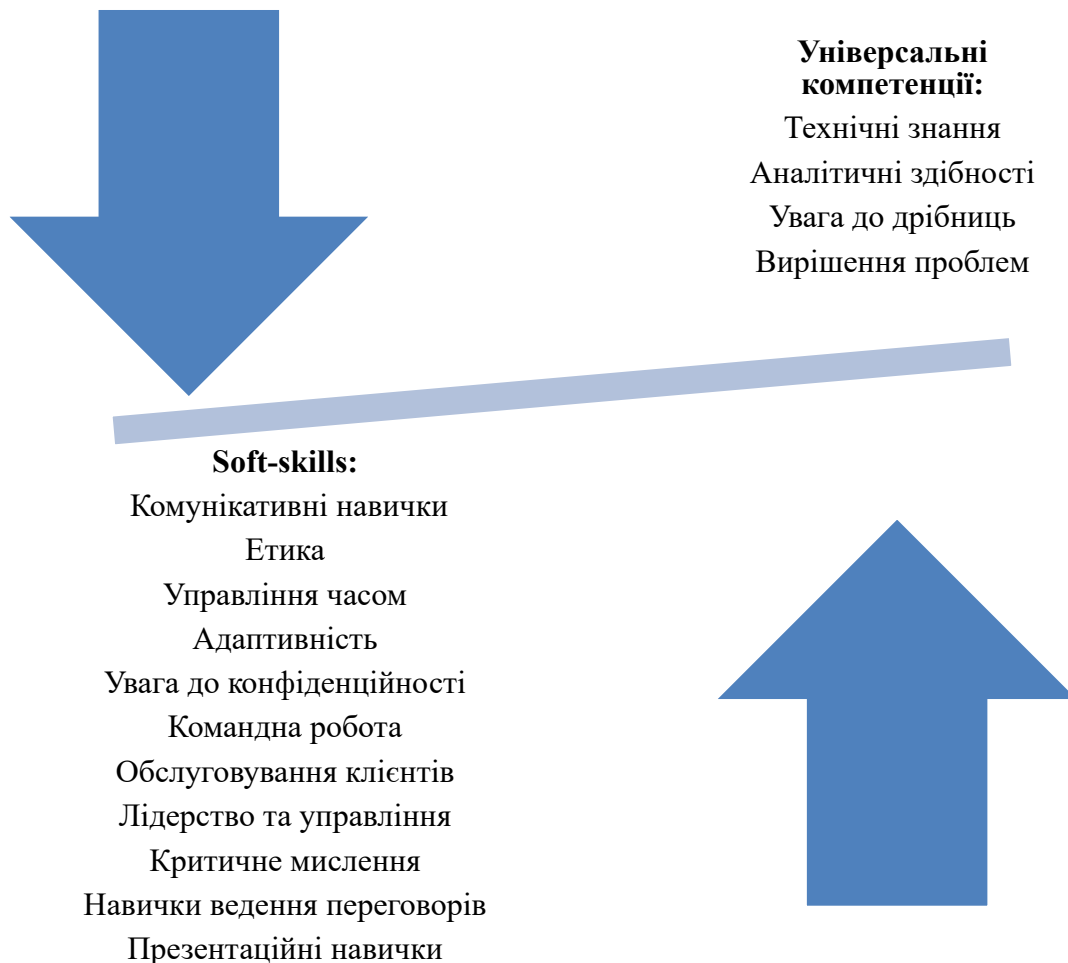
Рис. 1. Перелік універсальних компетенцій та soft-skills бухгалтера в сучасних умовах

1) зростає потреба у розвитку комунікативних навичок (в т.ч. і цифрової комунікації), адже спеціаліст з обліку надає фінансову інформацію як фінансовим, так і нефінансовим зацікавленим сторонам (сюди можна віднести складання звітності, проведення презентацій і передачу складних фінансових концепцій у зрозумілій формі);