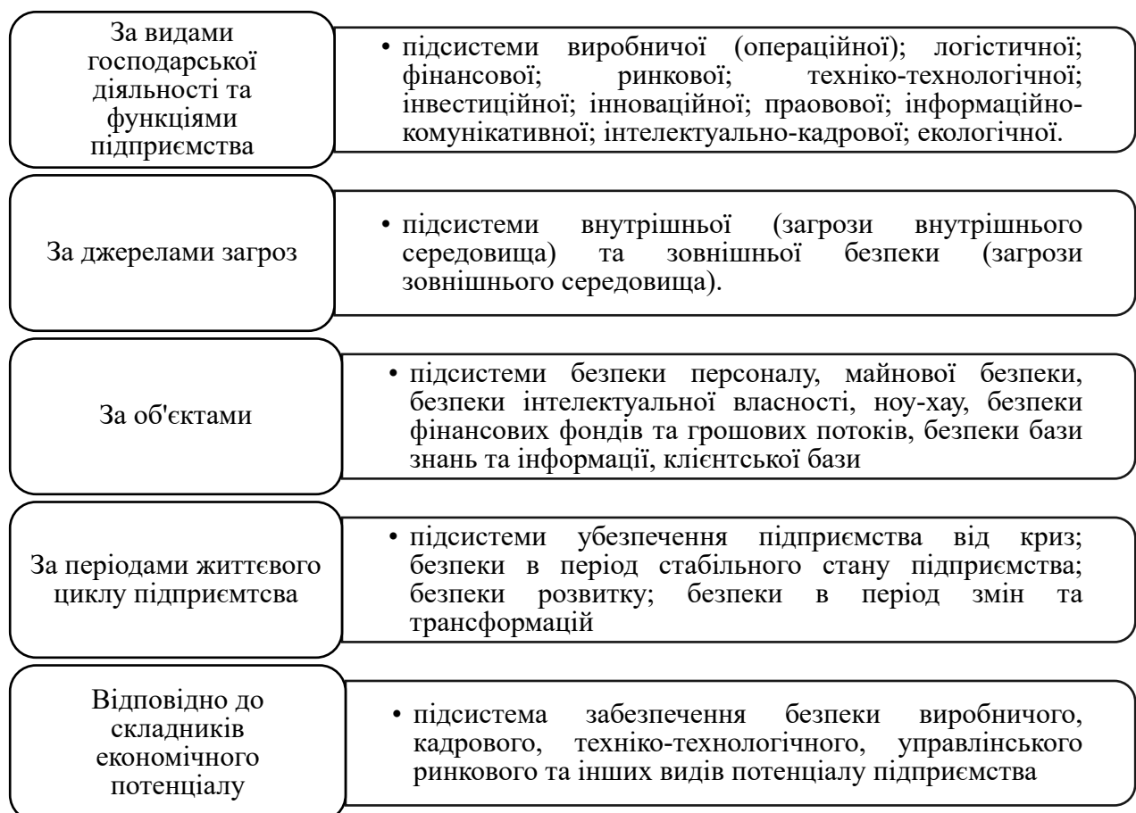
Рис. 1. Основні складники системи економічної безпеки підприємства

Разом з тим, система економічної безпеки підприємства інтегрує всі її підсистеми та елементи, від узгодженості та дієвості яких залежить її ефективність у цілому. Основні складники системи економічної безпеки підприємства відповідно до певних критеріїв їхньої класифікації відображено на рис. 1.