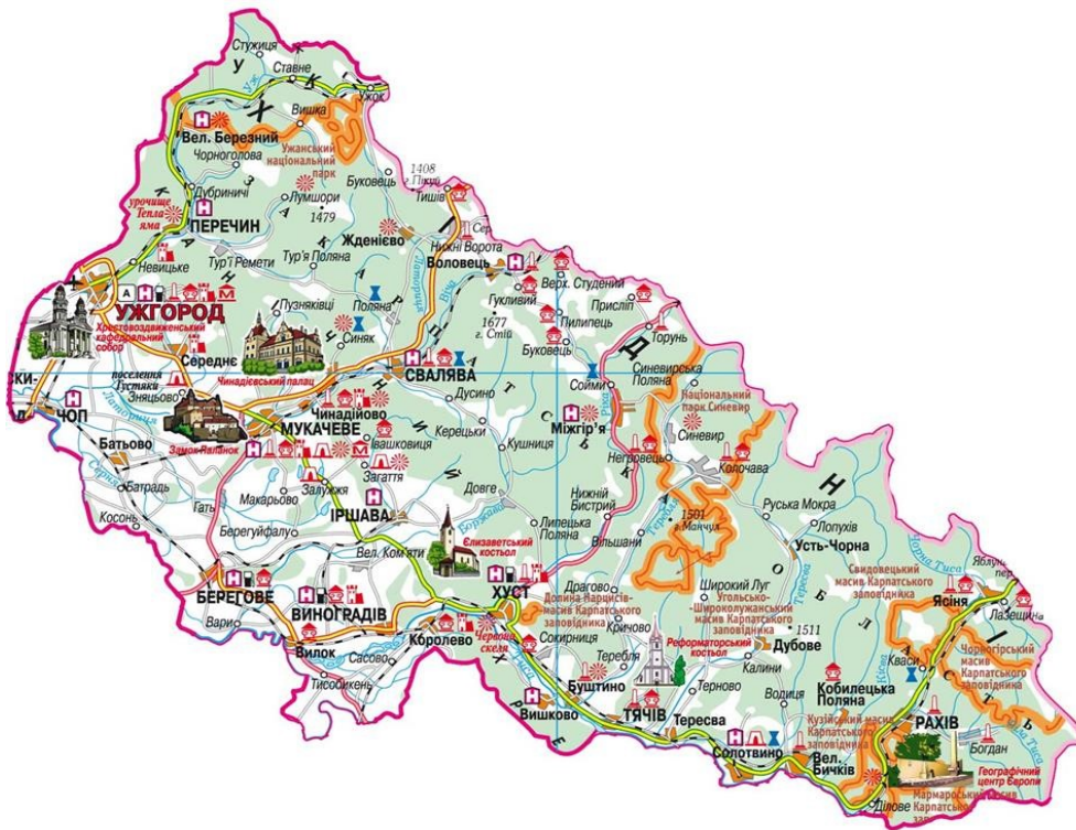
Рис. 1. Детальна туристична мапа культурних і історичних локацій Закарпаття [12]

У Закарпатській області існує великий потенціал для розвитку етнографічного туризму завдяки її природним ресурсам, досвідченим спеціалістам та вже відомим туристичним центрам. Однак, не зважаючи на всі ці можливості, не було проведено глибокого аналізу цієї сфери, і чимало потенціалу залишається невикористаним [10]. Закарпаття приваблює своєю унікальною природною та культурною спадщиною (рис. 1).