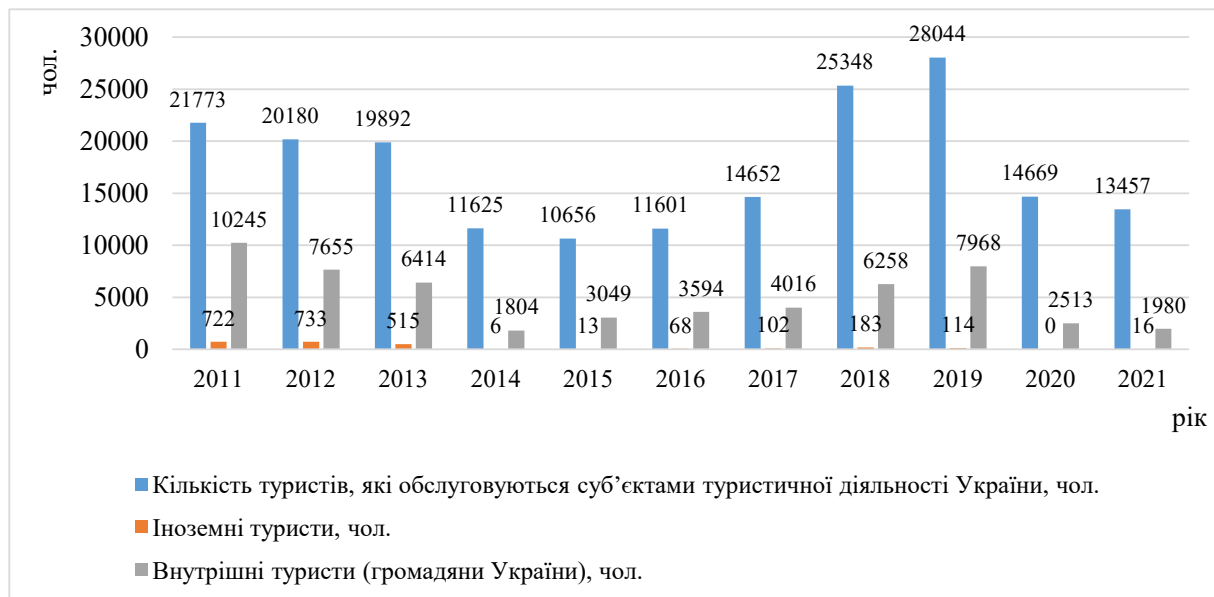
Рис. 2. Аналіз туристичних потоків в Закарпатті у період 2011-2021 рр., осіб [12]

Протягом 2011-2021 рр. Закарпаття прийняло 244 127 туристів, при цьому лише у 2021 р. – 13 457 осіб. Це стало найвищим показником з 2011 р. До початку російської повномасштабної агресії спостерігалось щорічне зниження туристичної активності в області [12]. Основні причини такого спаду були пов'язані з більшою доступністю відпочинку за кордоном, зростанням вимог туристів до комфорту проживання, якості обслуговування, включаючи медичні послуги, якості транспортних засобів та доріг. Натомість після початку російсько-української війни, обмеження можливостей для виїзду чоловіків за кордон в Закарпатті знову відмічається суттєве зростання кількості українських туристів на тлі різкого зниження туристичних потоків з-за кордону.