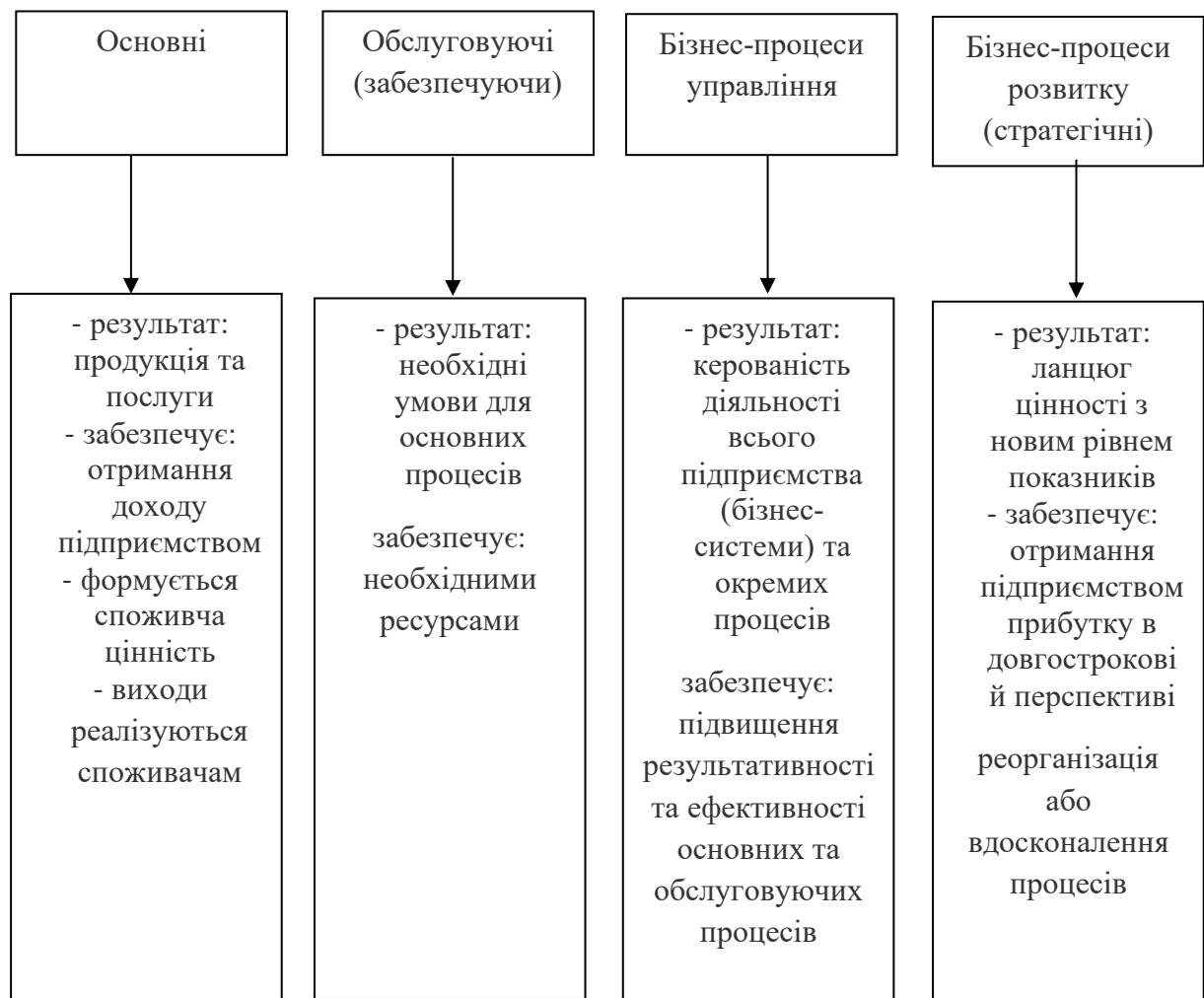
Рис. 1. Класифікація бізнес-процесів

Щодо класифікації бізнес-процесів, однією з найбільш вичерпною, на нашу думку, є поділ бізнес-процесів в залежності від їх функціонального призначення, що представлена на рис. 1.