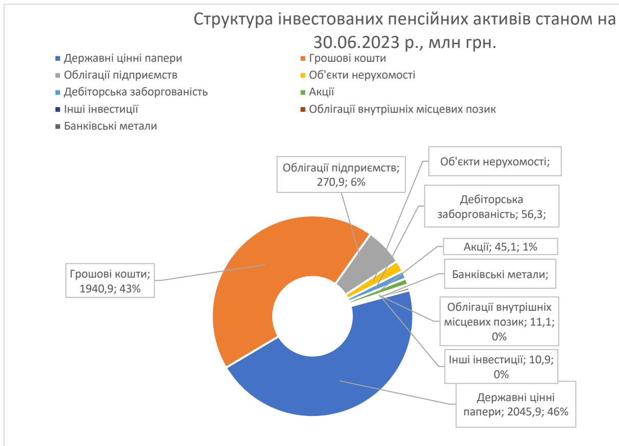
Рис. 1. Структура інвестованих пенсійних активів на 30.06.2023 р., млн грн.

Джерело: складено авторами на основі [10]