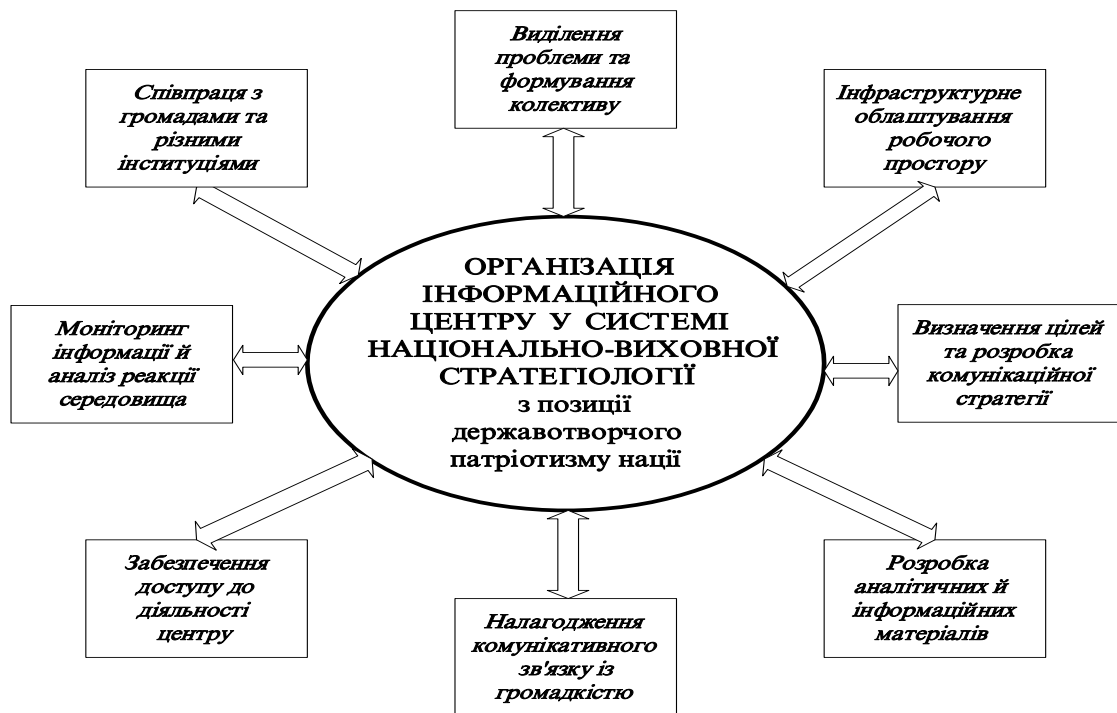
Рис. 2. Базові складові інформаційного центру у системі національно-виховної стратегіології з позиції державотворчого патріотизму нації за воєнного стану