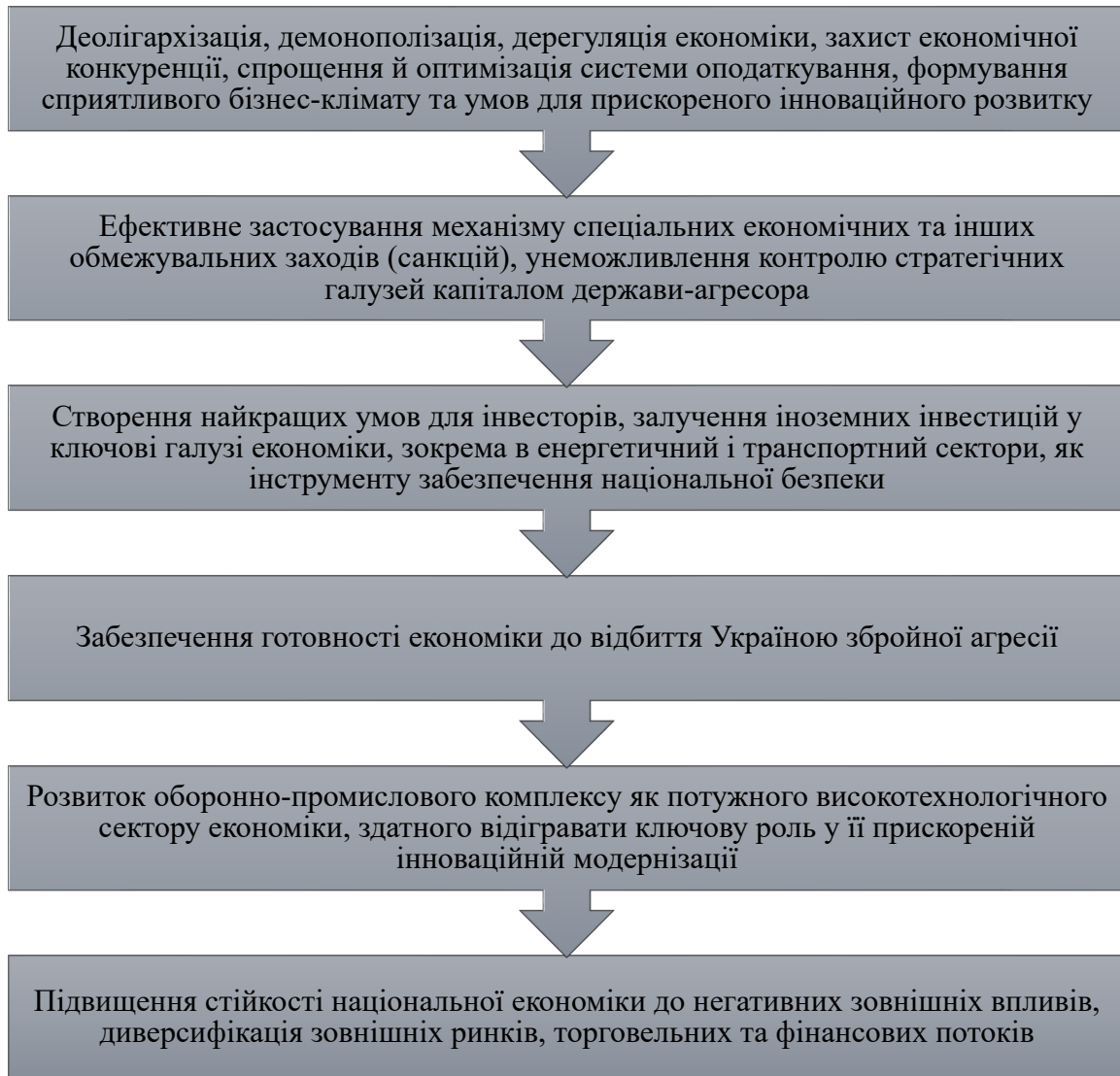
Рис. 2. Шляхи забезпечення економічної безпеки як умови досягнення економічного зростання