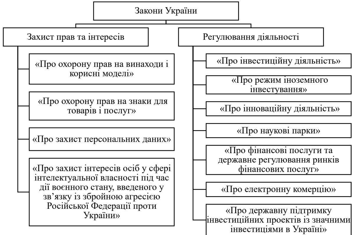
Рис. 2. Закони України, що регулюють діяльність стартапів

інвестиційних проектів із значними інвестиціями в Україні» (2020 р.), «Про захист інтересів осіб у сфері інтелектуальної власності під час дії воєнного стану, введеного у зв'язку із збройною агресією Російської Федерації проти України» (2022 р.) що також впливають на регулювання діяльності стартапів (рис. 2).