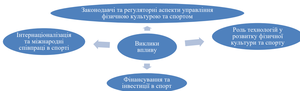
Рис. 1. Акумулювання викликів до фізичної культури та спорту у системі публічного управління

Акумулюючи виклики до публічного управління фізичною культурою та спортом доцільно представити їх у вигляді наступної схеми – рис. 1.