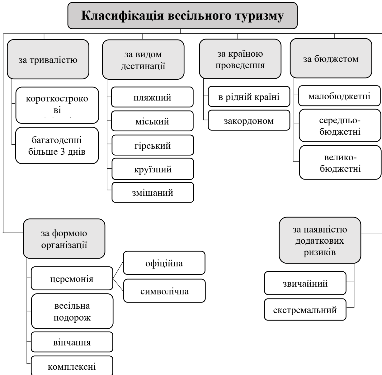
Рис. 1. Класифікація весільного туризму

З огляду на різні способи формування весільних турів, весільний туризм можна класифікувати за різними критеріями. Класифікацію весільного туризму представлено на рис. 1.