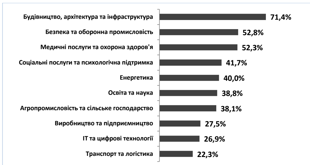
Рис. 3. Галузі та професії для відновлення України та актуальні напрями перекваліфікації для українців

1. Розвиток системи підготовки фахівців, характер і рівень кваліфікації яких відповідали б сучасним потребам ринку праці. Як влучно вважає в цьому контексті В. Близнюк: «Необхідно наблизити обсяги і структуру підготовки кадрів вищими та професійно-технічними закладами до обсягів і структури попиту на ринку праці» [4, с.79]. Плануючи майбутнє повоєнне відновлення, варто звернути увагу на галузі, які найбільше потребуватимуть робочої сили. Так, за даними порталу Career hub, сферами, де будуть найбільш затребувані відповідні фахівці, є: будівництво і архітектура, безпека і оборонна промисловість, медичні послуги тощо (рис. 3). Відтак, постає необхідність розширення підготовки фахівців за цими напрямками як в межах системи вищої освіти, так і в системі професійної (професійно-технічної) освіти.