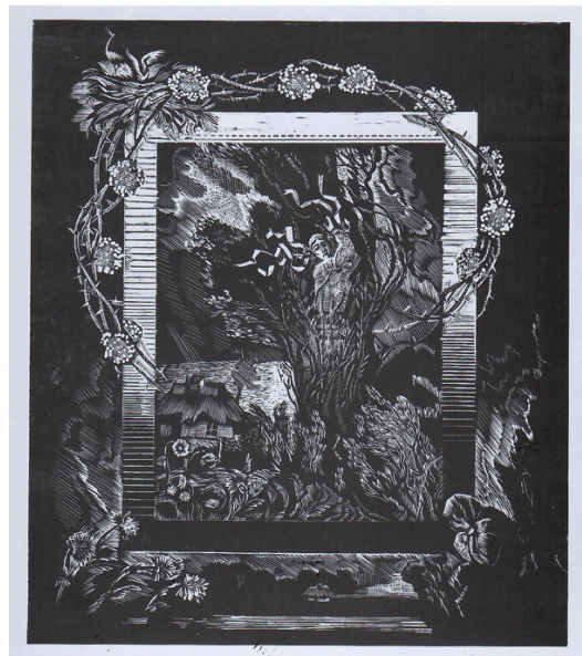
Рис. 2. «Тополя», 1985

Талановитий дизайнер-графік дуже тонко відчуває український національний колорит і передає у своїх творах усю красу та духовність рідного краю. Ілюстрація до вірша Т. Шевченка «Заповіт» – «В сім'ї вольній, новій» вражає своєю складною і динамічною композицією. Вона передає глядачеві драматично піднесений настрій і віру Кобзаря у світле, щасливе майбутнє. Динамічними діагоналями створюється враження свіжого вітру,