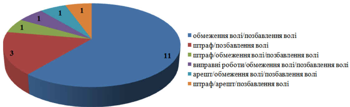
Діаграма 2. Кількісний та якісний показник санкцій, які передбачають покарання альтернативні позбавленню волі за тяжкі злочини

Покарання у виді обмеження волі являє собою тримання особи у виправних центрах без ізоляції від суспільства в умовах здійснення за нею нагляду з обов'язковим залученням засудженої особи до праці. З урахуванням положень ст. 61 КК України, даний вид покарання може бути призначено на строк від одного до п'яти років, за виключенням щодо осіб, які підпадають до категорії неповнолітніх; вагітних жінок; жінок, що мають дітей віком до чотирнадцяти років; осіб, що досягли пенсійного віку; військовослужбовців строкової служби; осіб з інвалідністю першої та другої групи.