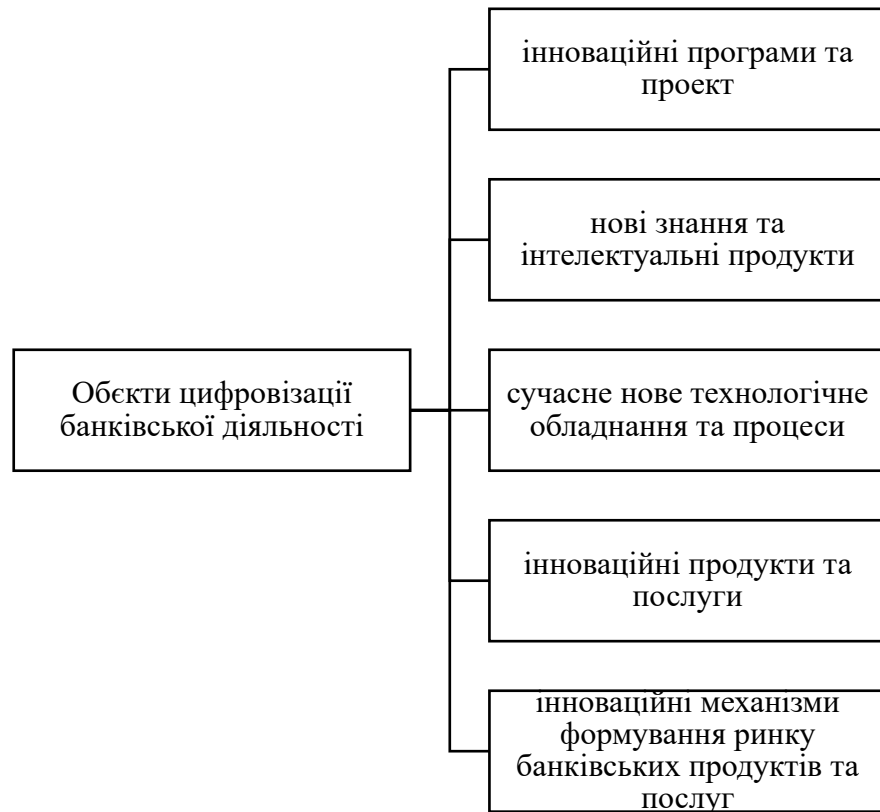
Рис. 1. Об'єкти цифровізації банківської діяльності