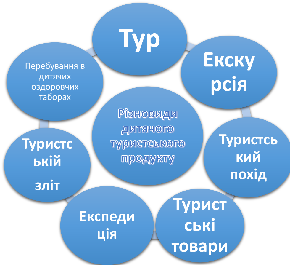
Рис. 3. Різновиди дитячого туристського продукту