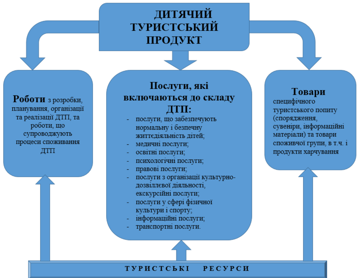
Рис. 2. Структурна схема дитячого туристського продукту

В статті пропонується розуміти під дитячим туристським продуктом - комплекс певної кількості та якості послуг і товарів, необхідних для задоволення потреб дітей при перебуванні в тому чи іншому туристському регіоні, заснованих на використанні місцевих туристських ресурсів і пропонується для реалізації за єдиною ціною (рис. 2).