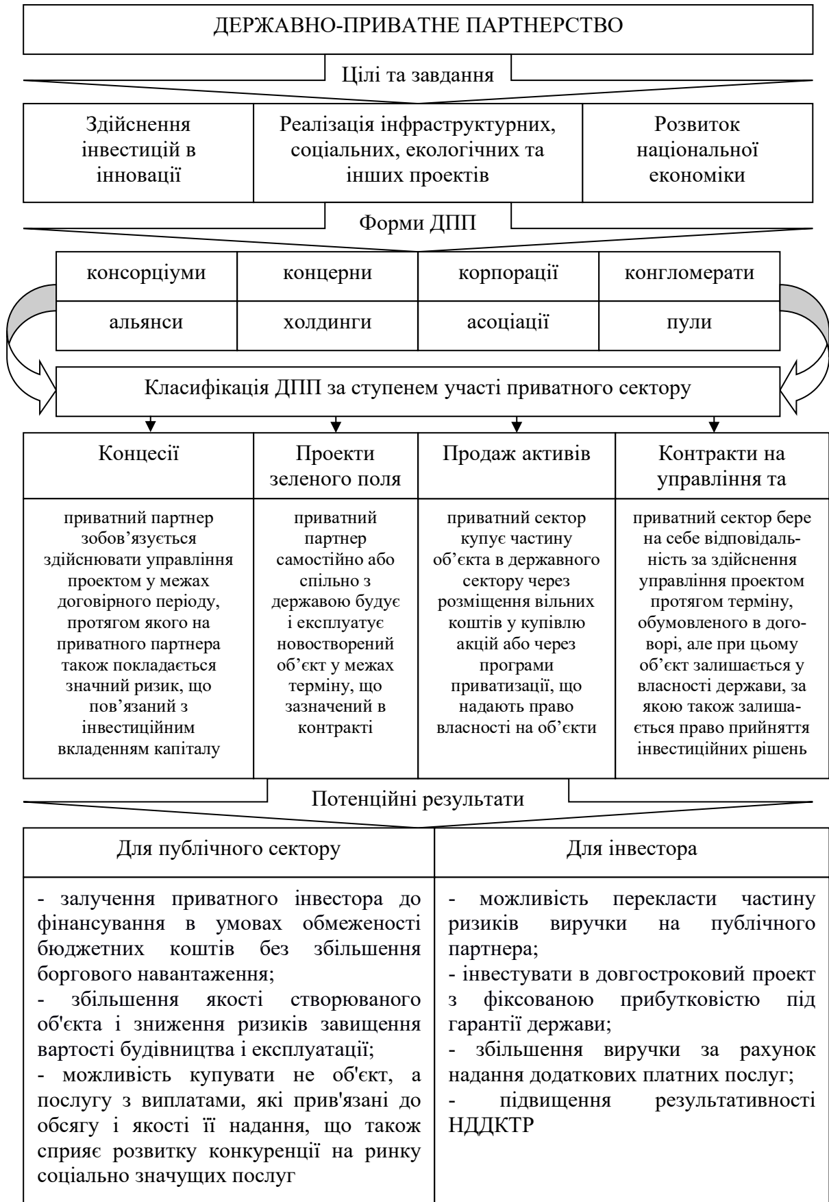
Рис. 1. Характеристика державно-приватного партнерства