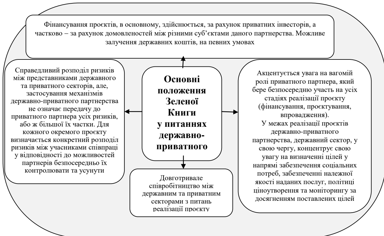
Рис. 2. Основні положення Зеленої книги у питаннях державно-приватного партнерства

Розглянемо на Рис. 2. основні ознаки, які характеризують проекти державно-приватного партнерства, згідно з положеннями Зеленої книги Європейського Союзу.