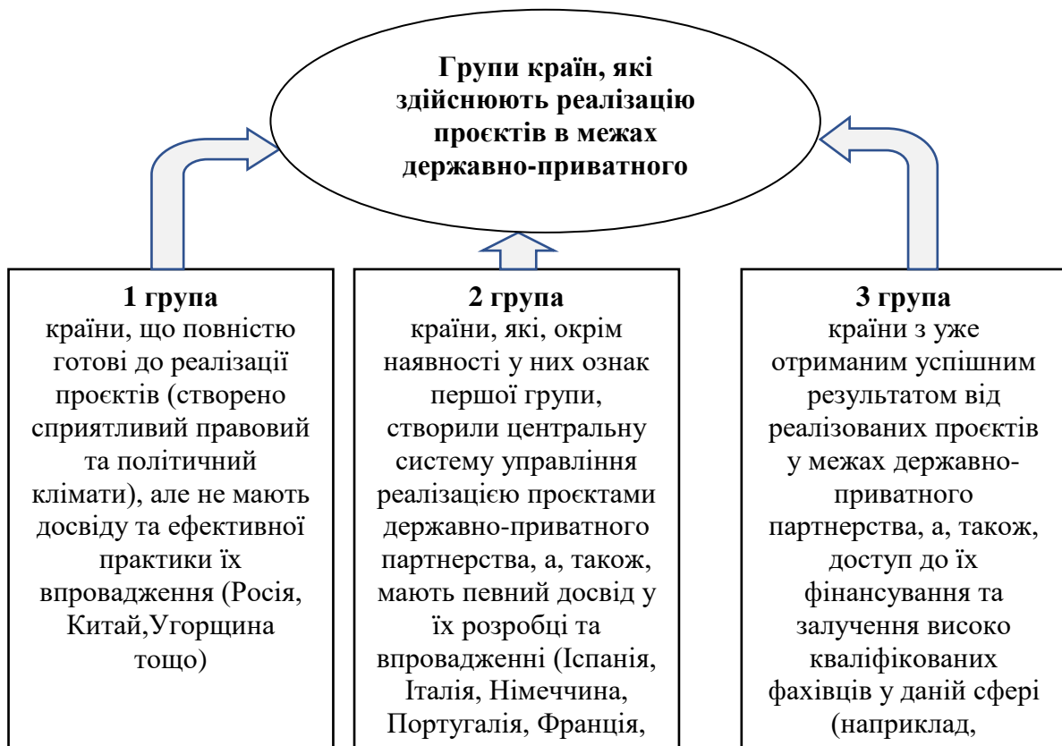
Рис. 1. Групи країн світу за ступенем підготовленості до здійснення реалізації проєктів у межах державно-приватного партнерства

Для країн Європейського Союзу початок 90-х років ХХ століття ознаменувався певним «стрибком» щодо впровадження у практику їх розвитку механізмів державно-приватного партнерства у сфері економіки. Ключовою передумовою, на даному етапі формування та розвитку даних механізмів, стала незадоволеність громадян у якості наданих державою послуг та низькому рівні конкурентоспроможності країни. Тож, уряди країн шукали додатковий спосіб для поліпшення такої ситуації, яким і стали механізми державно-приватного партнерства.