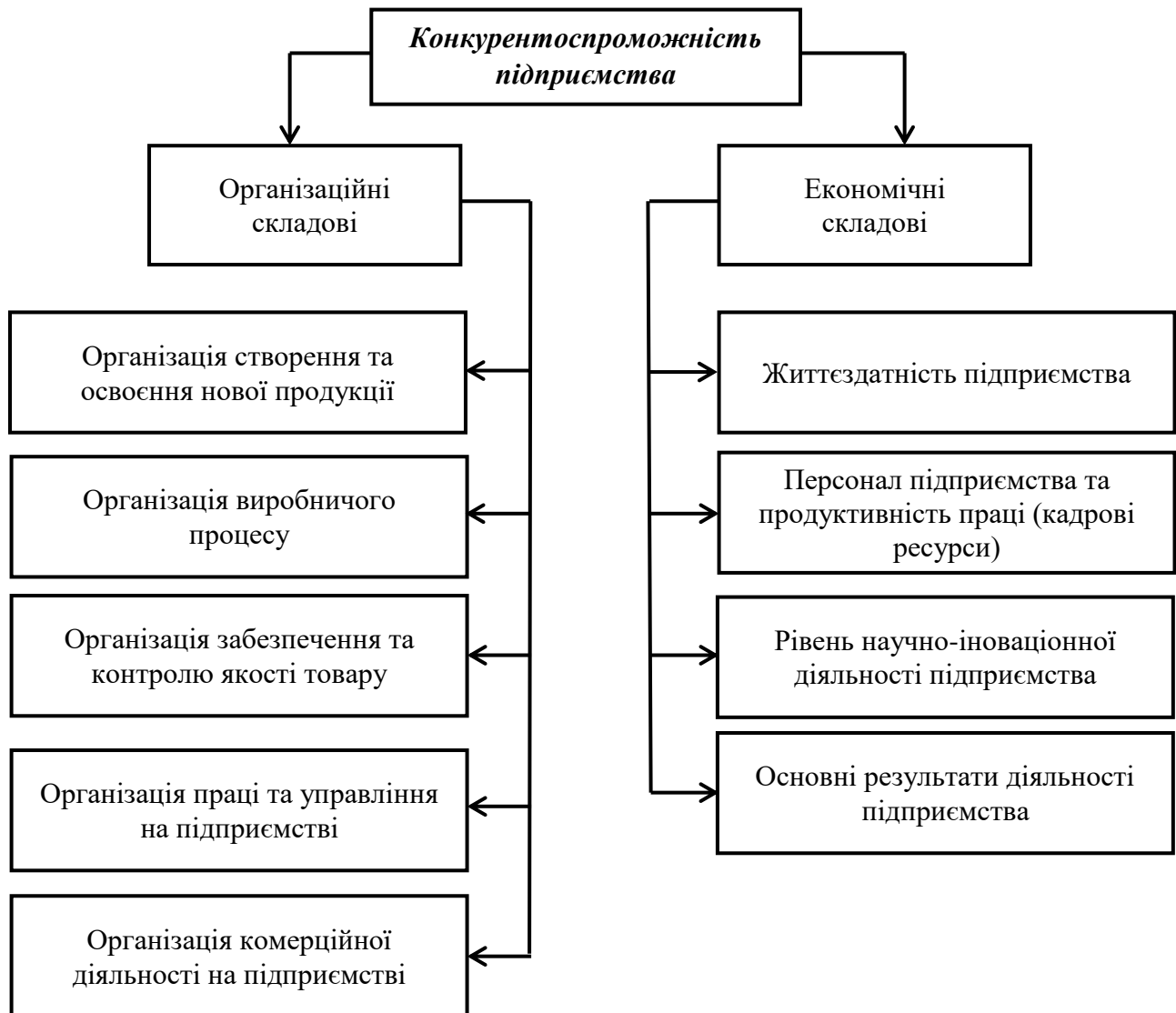
Рис. 1. Організаційно-економічні складові конкурентоспроможності підприємств

Одним зі значних організаційних складових є створення та освоєння нової продукції. Нова продукція на ринку впливає на конкурентоспроможності, що сприяє на підвищення прибутків підприємства.