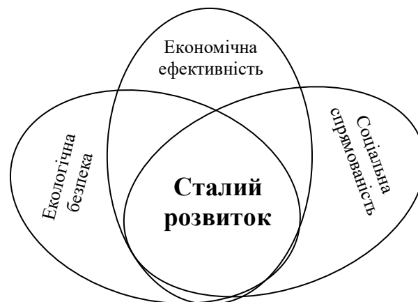
Рис. 1. Складові сталого розвитку

Сталим є розвиток, що задовольняє потреби сьогодення і водночас не перешкоджає майбутнім поколінням у задоволенні їх потреб [1]. Загалом сталий розвиток передбачає поєднання трьох аспектів, екологічного, соціального та економічного (Рис. 1), між якими необхідно досягти оптимального співвідношення.