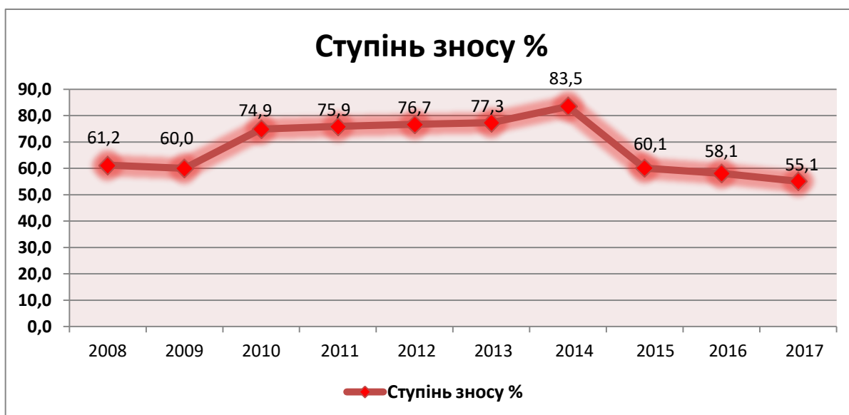
Рис. 2. Ступінь зносу основних засобів підприємств України за 2007–2017 роки [1]

Отже, можемо простежити тенденцію зменшення вартості основних засобів, починаючи з 2010 року, а ступінь зносу, як ми бачимо на рис. 2, постійно збільшується в період з 2009 до 2014; у 2015 зафіксовано зменшення ступеня зносу на 23,4% до 60,1% у зв'язку з прийняттям Постанови Кабміну України No 200 щодо передачі/надходження та оцінки основних засобів.