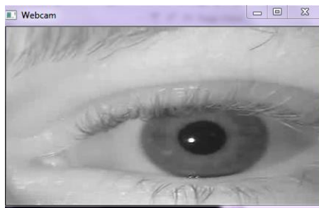
Рис. 1. Приклад кадру з відеоряду

Для детектування очей використовується алгоритм Віоли Джонса, який представлений функцією detectmultiscale [4]. Для визначення локалізації зіниці необхідно провести бінаризацію, яка позбавить від неінформативних пікселів, тобто світлих ділянок кадру.