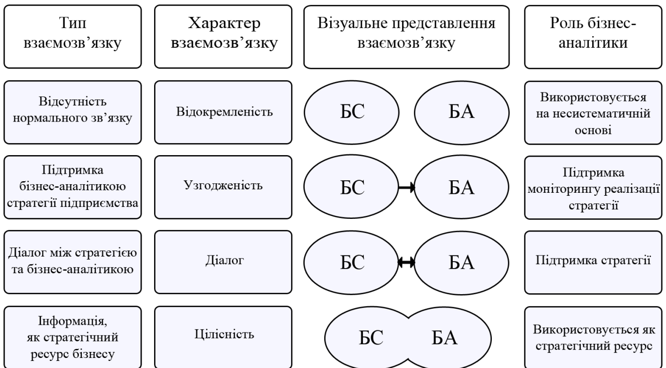
Рис. 2. Зв'язки бізнес-стратегії та бізнес-аналітики на підприємстві.

Завдання бізнес-аналітики формуються на основі цілей управління, а її результати представляють суб'єктам управління. Тому відправної точкою аналітичної діяльності на підприємстві є стратегія його розвитку. Можна визначити чотири типи взаємозв'язку між бізнес-стратегією та бізнес-аналітикою на підприємстві (рис. 2).