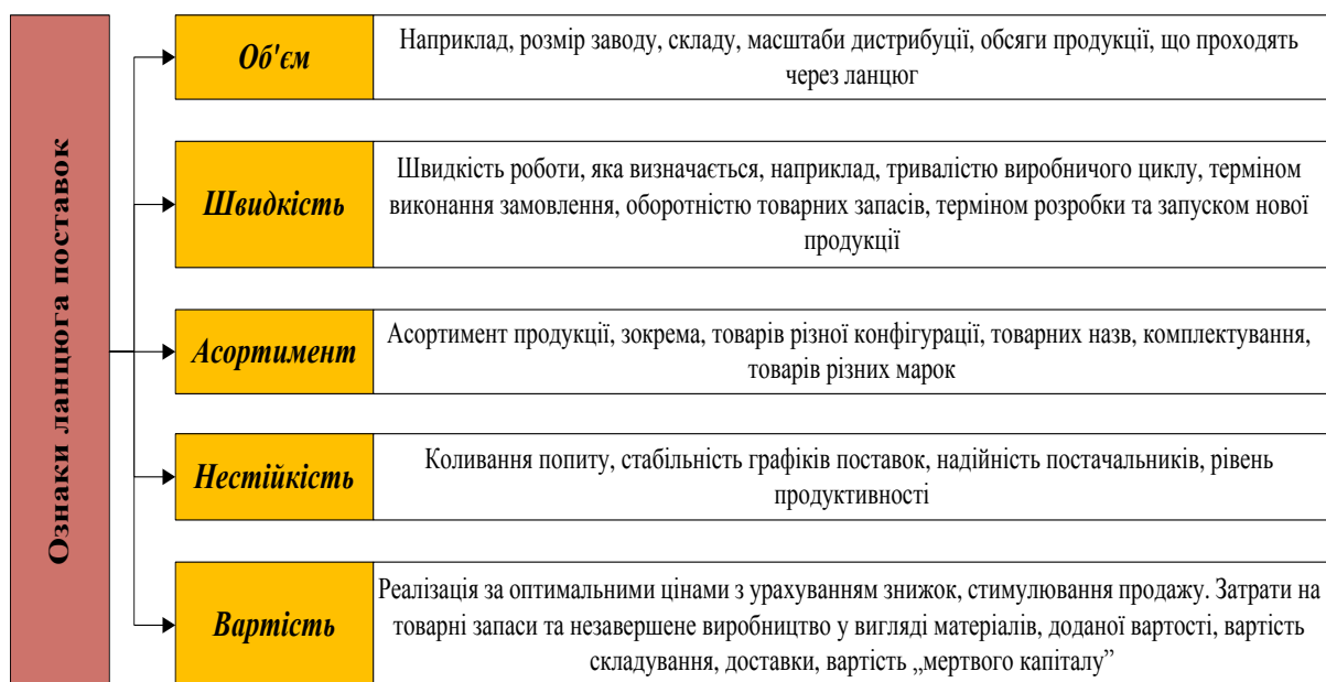
Рис.3. Ознаки ланцюга доставок [розроблено автором на основі джерела: 4, с.52].

Також ефективність функціонування ланцюга доставок можна визначити за допомогою наступних ознак, відображених на рис.3.