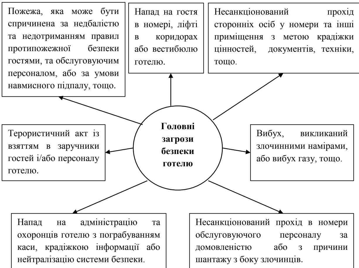
Рис.1. Головні загрози безпеки готелю. Складено авторами на основі [2]

відповідності із діючим законодавством України та взаємодію персоналу готелю з правоохоронними органами. Організаційна компонента відповідає за регламентування дій персоналу готелю, стосовно безпеки, інтегрує усі вказані компоненти в одно ціле, і систему безпеки в цілому в загальну систему управління роботою готельного підприємства. Саме цій компоненті системи безпеки готелю приділено увагу в даній статті.