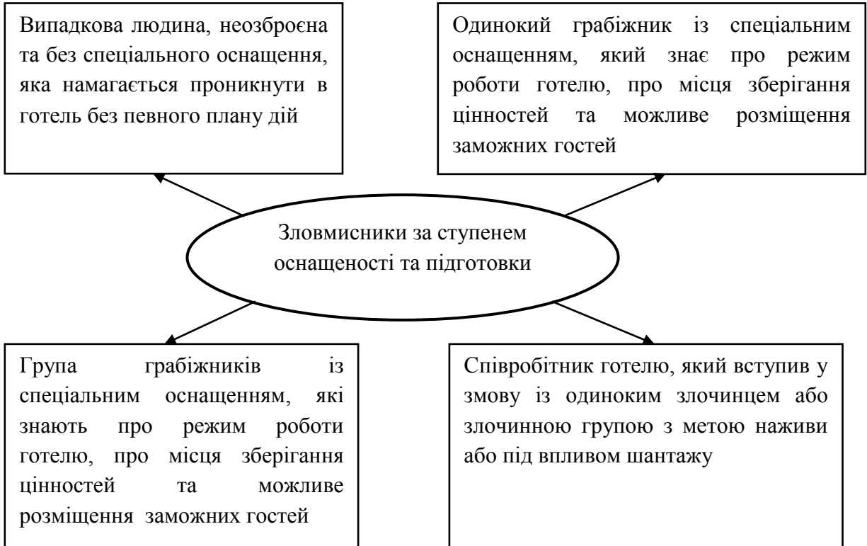
Рис. 2. Групи зловмисників за ступенем оснащення та підготовки. Складено авторами на основі [1]

В основному забезпечення безпеки в готелі здійснюють за допомогою людського та технічного ресурсу. Тому ключове значення, при організації безпеки, набуває правильний вибір персоналу та технічних засобів, систем безпеки, їх правильне проектування та обслуговування.